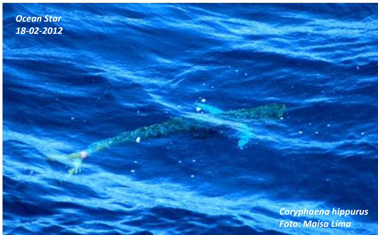
Foto: Sim ( ) Não ( ) Fotos nº: 2012.02.18.BIOTA-254.F (3)