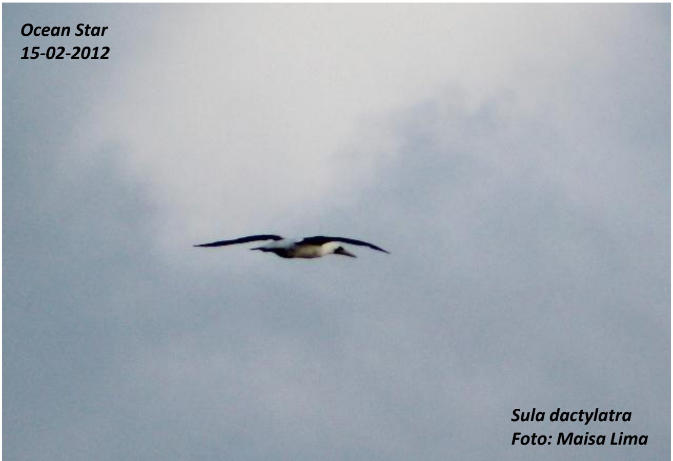
Sula dactylatra