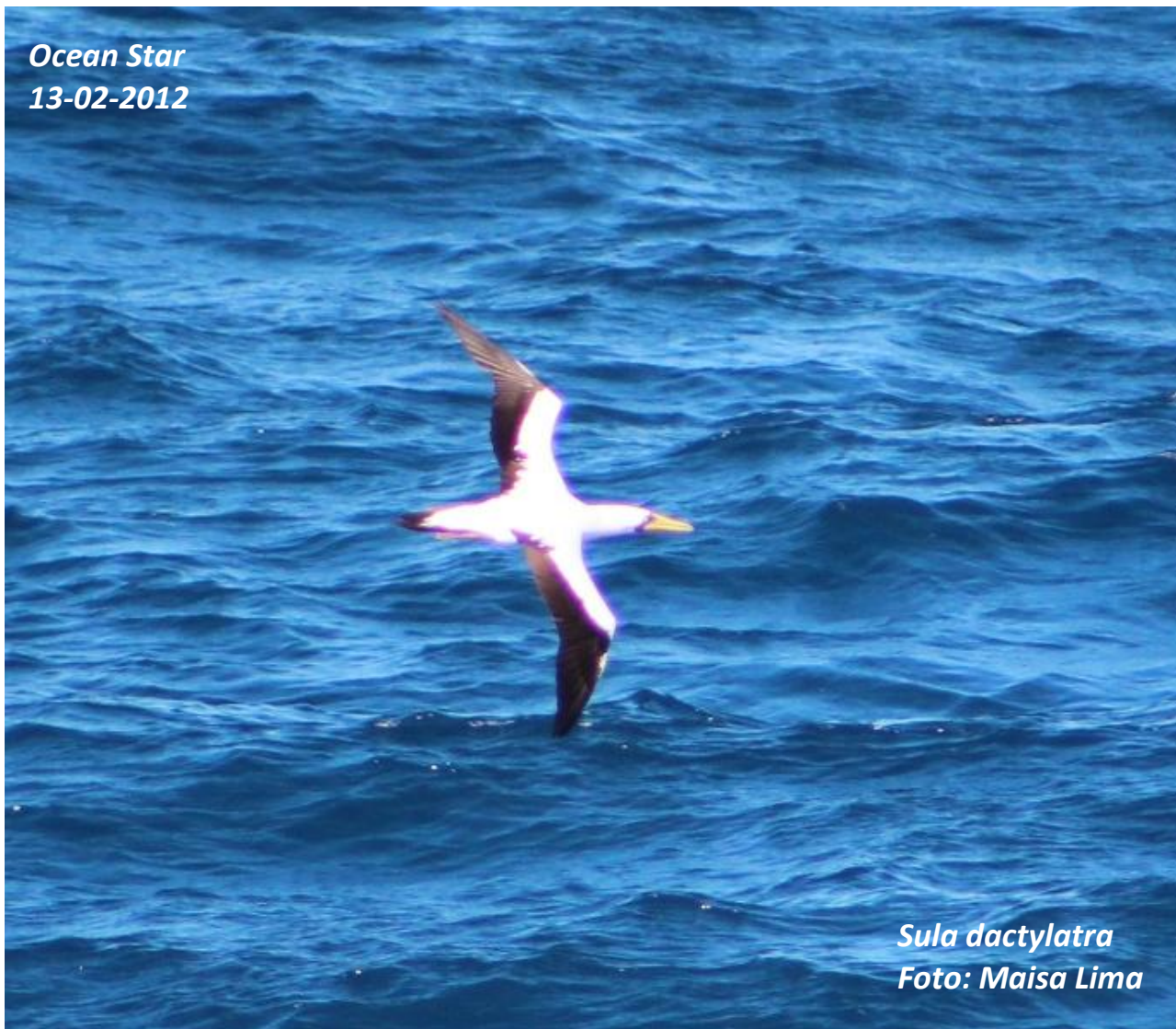
Sula dactylatra