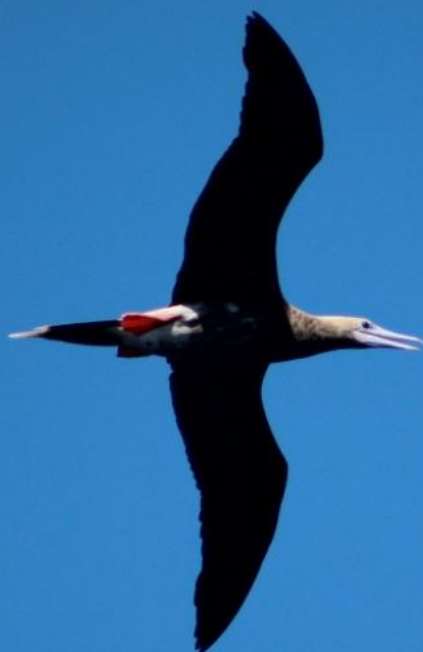
Sula sula Atobá de patas vermelhas