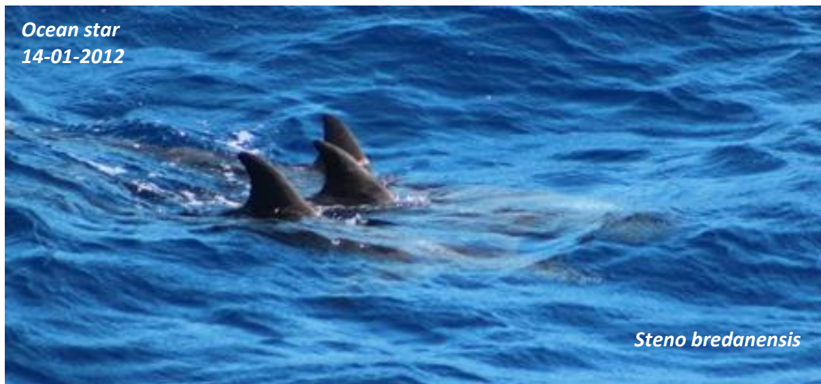
Foto: Sim ( x ) Não ( ) Fotos nº: 2012.01.14.BIOTA-200 F(16) e (74)

Observações: animais se aproximaram da plataforma por nordeste; houve registro de comportamento de transferencia de alimento de um adulto para um imaturo e ainda e ainda interação com um barco de pesca que estava realizando pesca no entorno da plataforma.