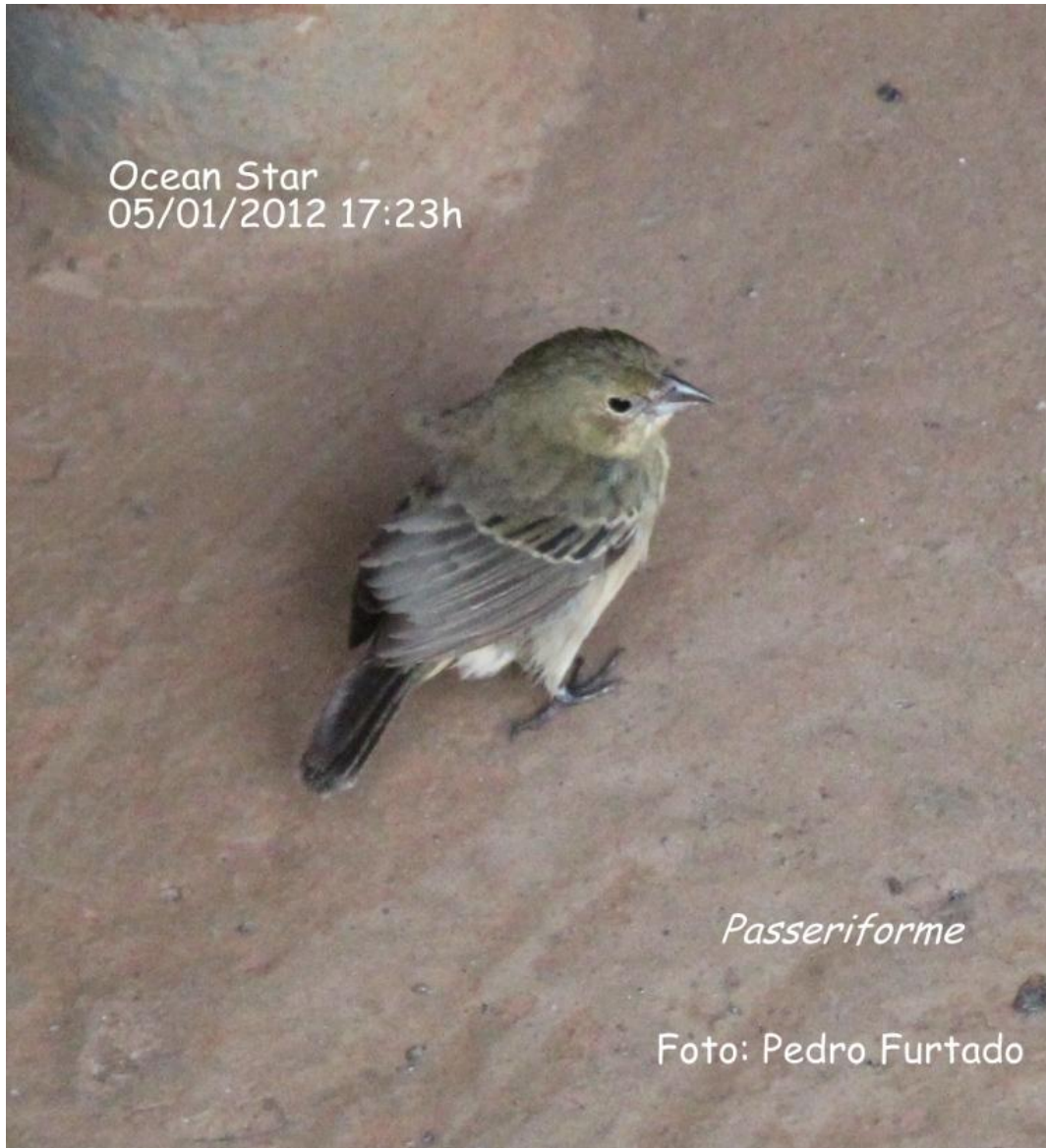
Foto: Sim ( x ) Não ( ) Fotos nº: 2012.01.05.BIOTA-182.F182

Observações: O animal foi visto na plataforma e após ser fotografado voou.