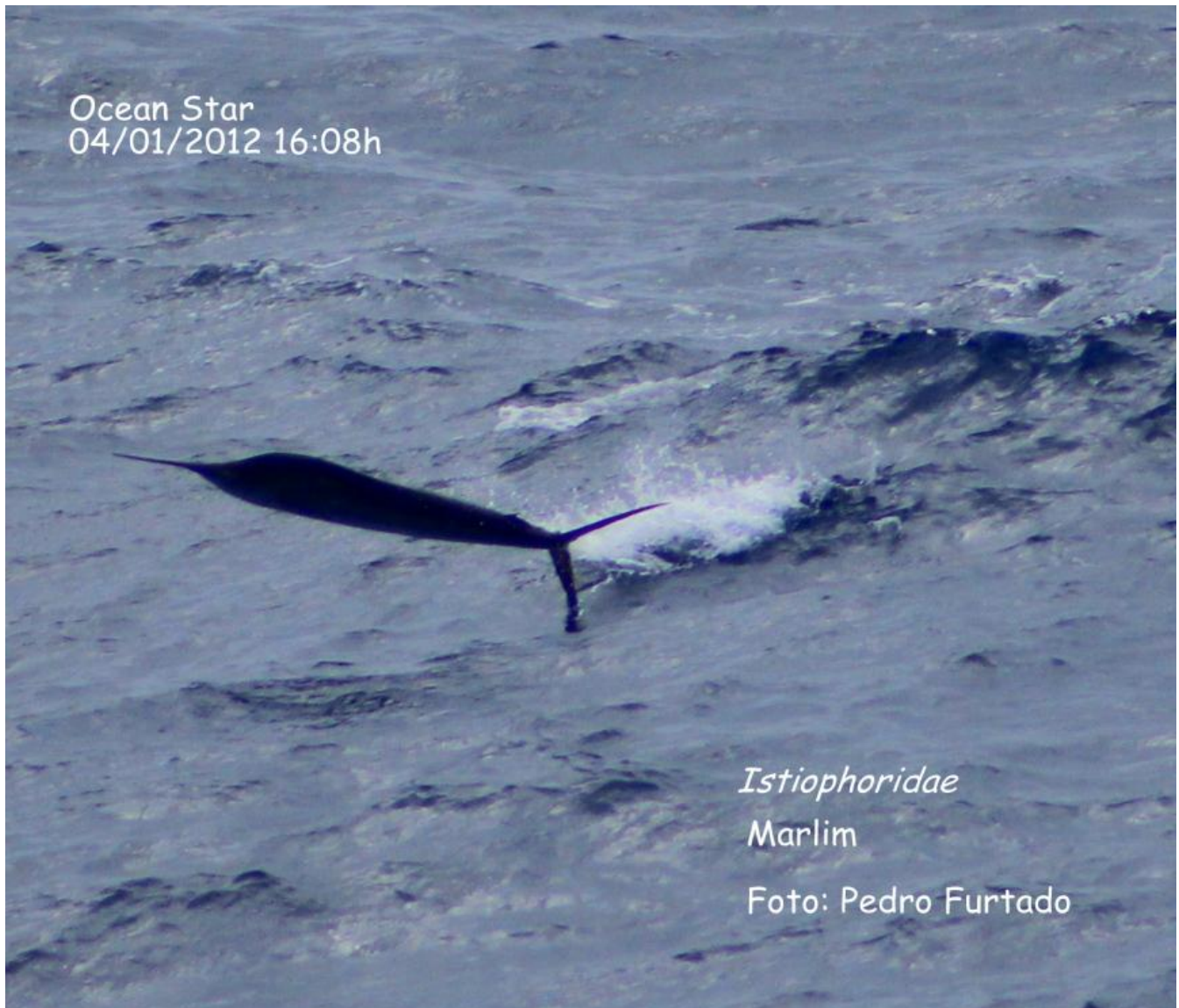
Foto: Sim ( x ) Não ( ) Fotos nº: 2012.01.04.BIOTA-178.F178

Observações: O animal foi visto saltando a 50m da plataforma em deslocamento rápido. Após 3 saltos não foi mais possível observar o mesmo que seguiu em direção a NW.