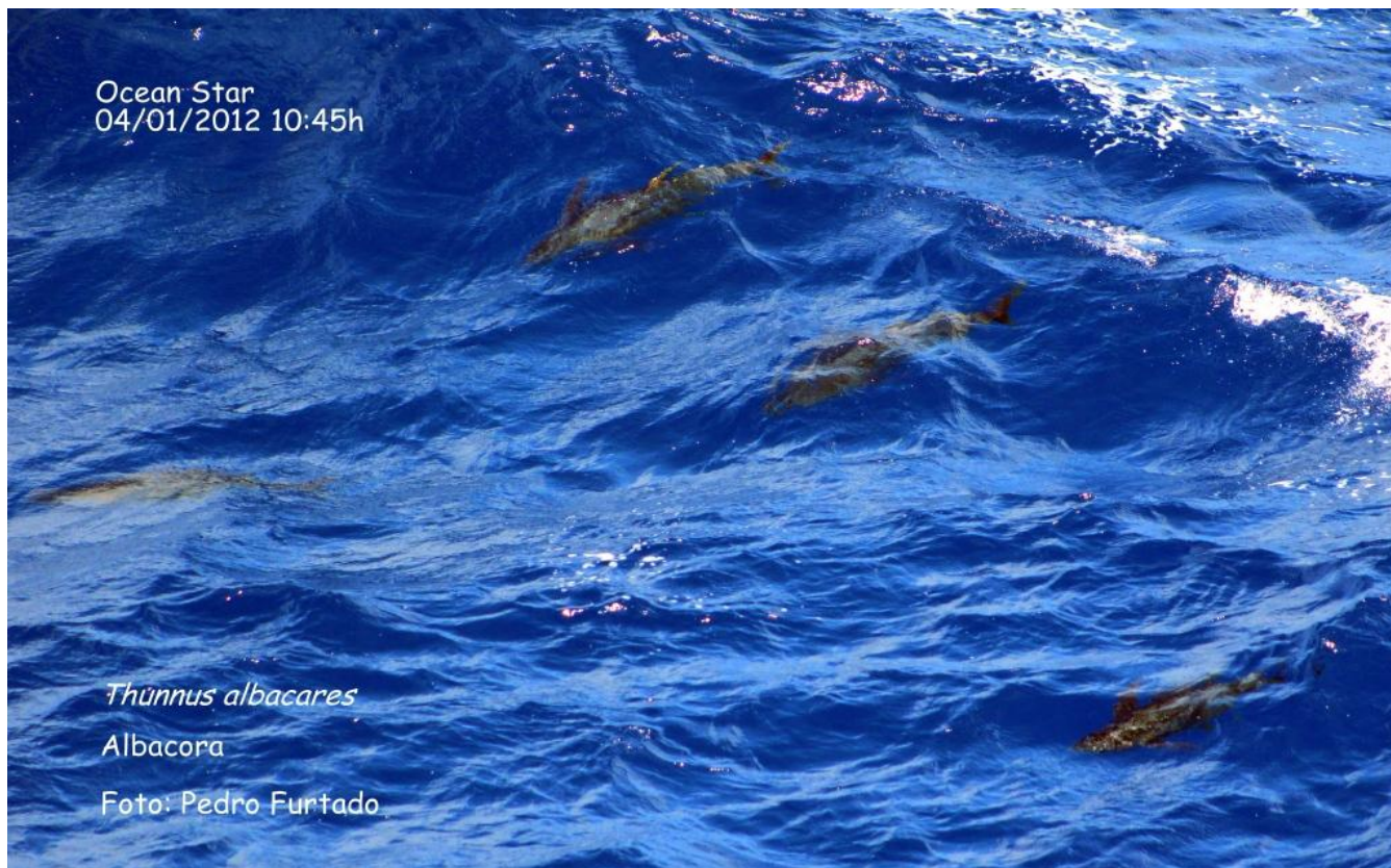
Foto: Sim ( x ) Não ( ) Fotos nº: 2012.01.04.BIOTA-174.F174

Observações: O grupo foi visto vindo de NW em deslocamento lento. Foram vistos pela última vez dirigindo-se em direção N