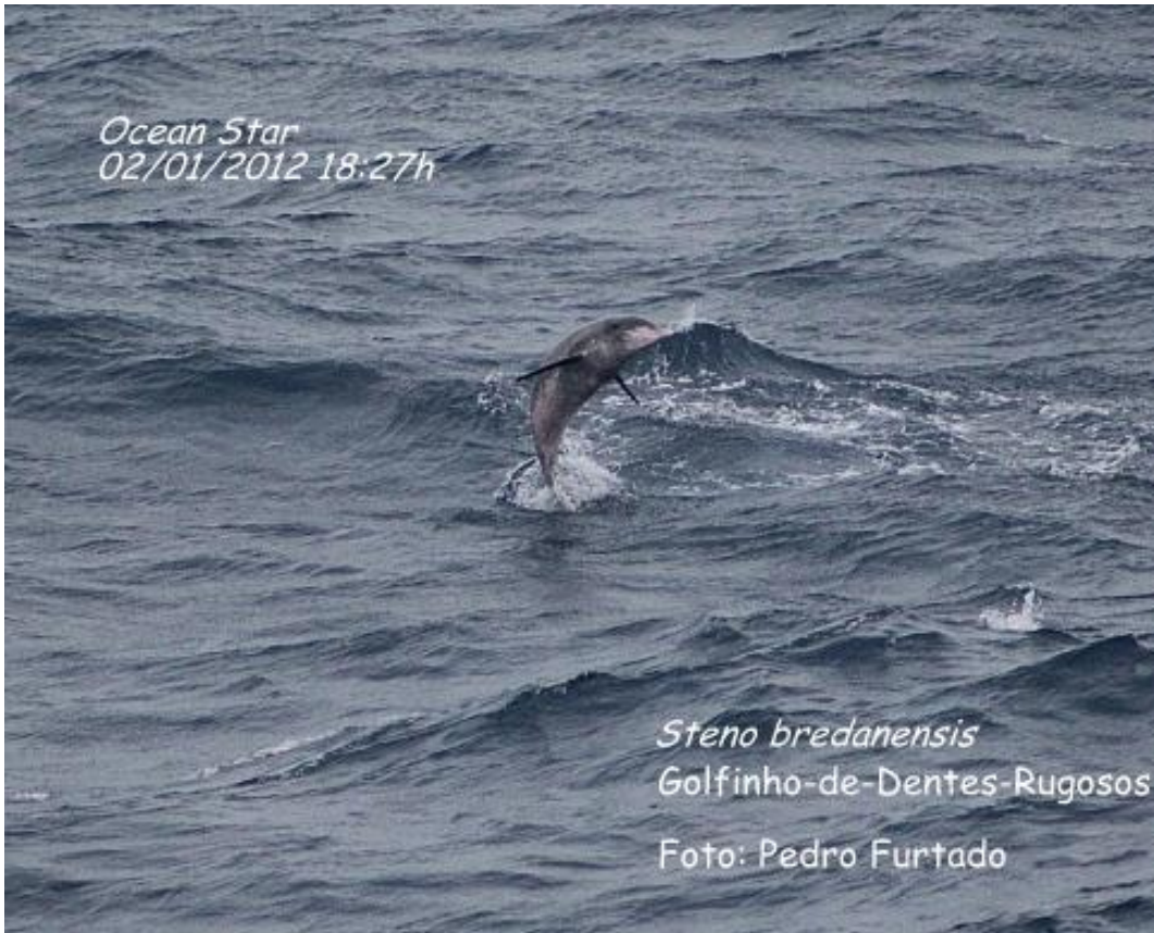
Foto: Sim ( x ) Não ( ) Fotos nº: 2012.01.02.BIOTA-171.F171

Observações: O grupo foi visto no fim do dia em deslocamento rápido para sul. Foi possível observar saltos totais e tempo maior de apnéia.