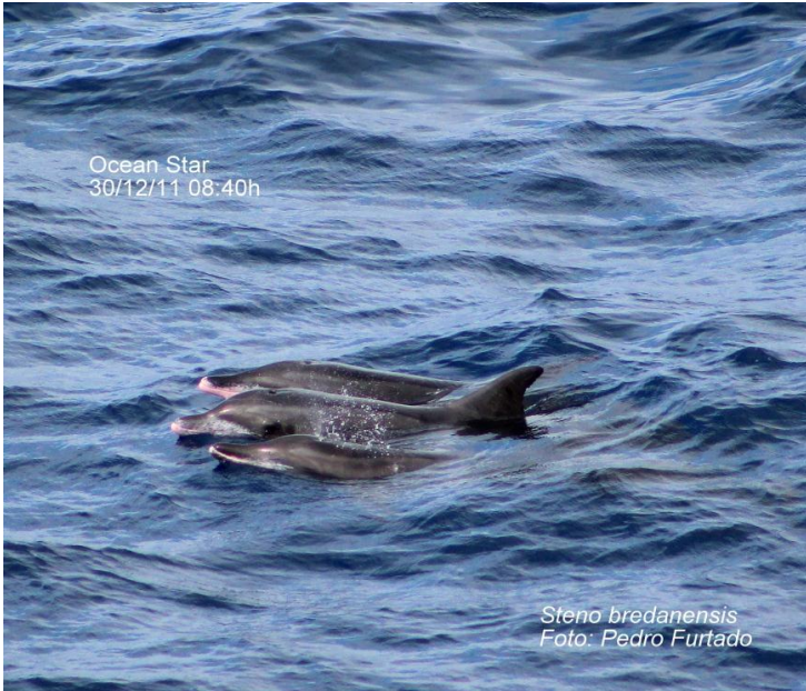
Foto: Sim ( x ) Não ( ) Fotos nº: 2011.12.30.BIOTA-161.F161

Observações: Os animais foram vistos em descanso logo pela manhã ao S da plataforma, depois surgiu grupo de S. attenuata . Houve socialização entre os grupos. Ambos os grupos permaneceram o dia inteiro nos arredores da plataforma. Ao fim da tarde desapareceram seguindo em direção E.