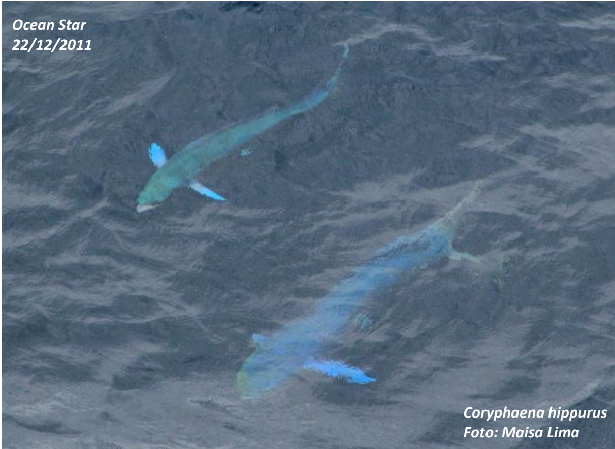
Coryphaena hippurus