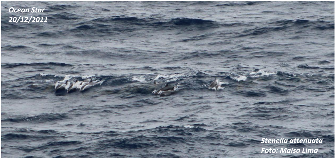
Foto: Sim ( ) Não ( ) Fotos nº: 2011.12.21.BIOTA-140 F(1)