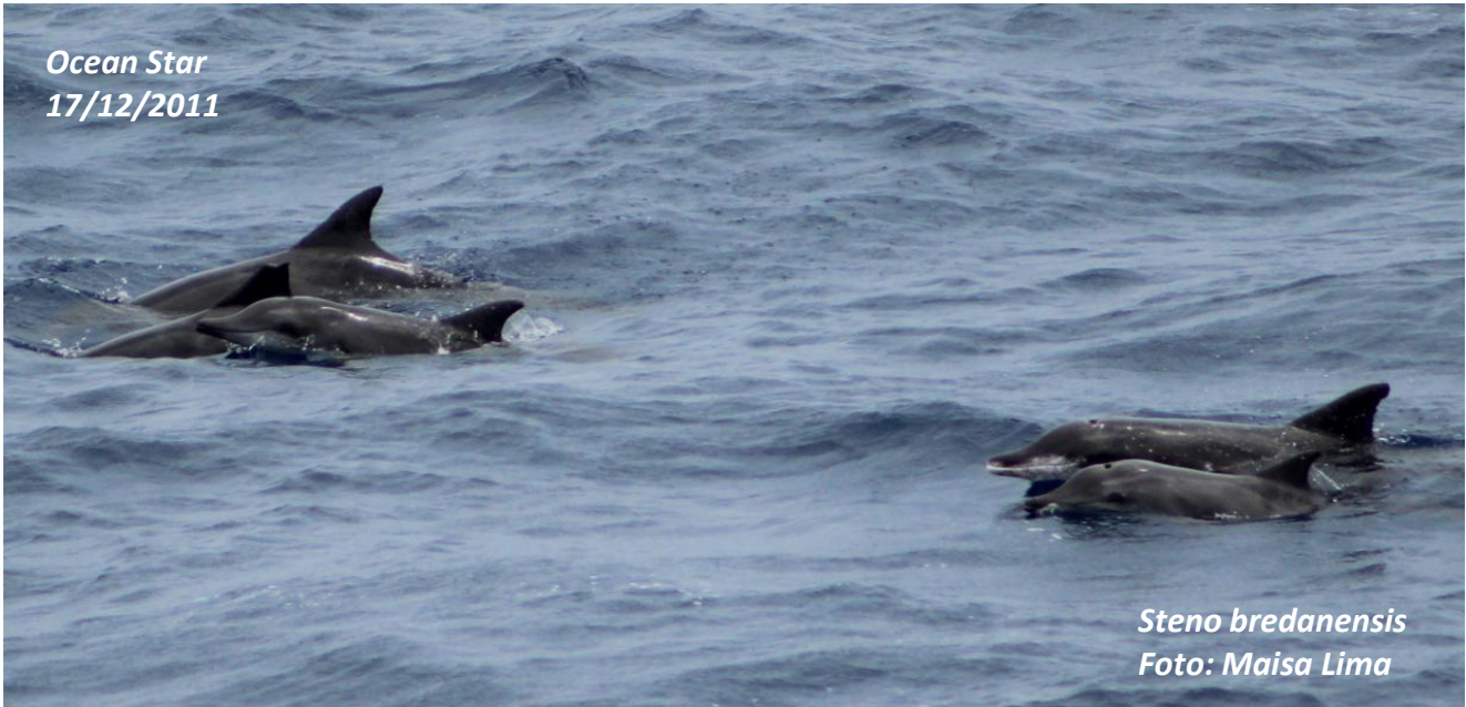
Foto: Sim ( ) Não ( ) Fotos nº: 2011.12.17.BIOTA-132 F (1)

Observações: pela tarde também foi registrado um grupo de Stenella attenuata e um grupo de Steno bredanensis . Ambos passaram a maior parte do tempo separados mas houve momentos em que ocorreu interação, com comportamento agonístico. Os animais ficaram deslocando entre leste e sudeste, bem próximo a plataforma.