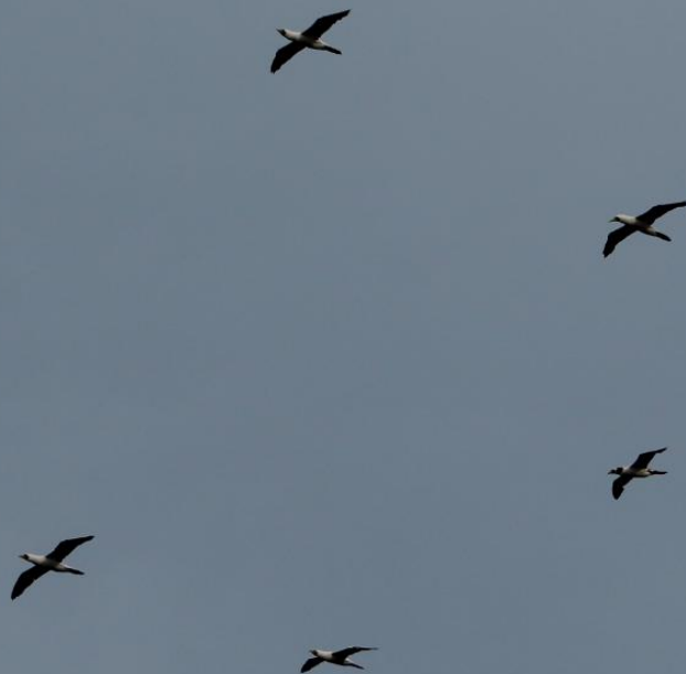
Sula dactylatra