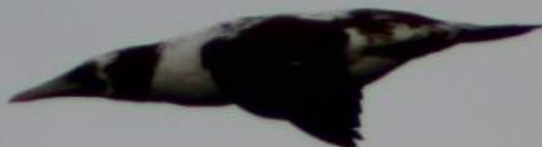
Sula dactylatra