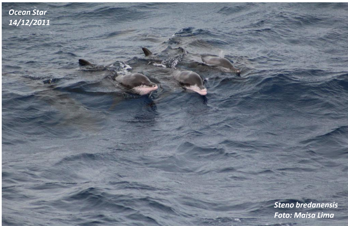
Foto: Sim ( ) Não ( ) Fotos nº: 2011.12.14.BIOTA-114.Steno bredanensis F (2)