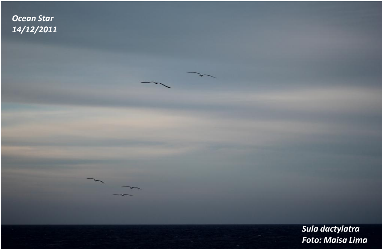
Sula dactylatra