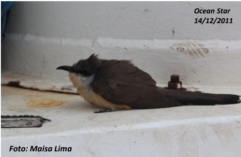
Foto: Sim ( ) Não ( ) Fotos nº: 2011.12.14.BIOTA-110-Ave morimbunda F(3), (4), (5) e (6)