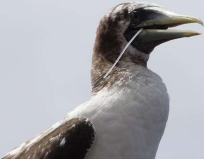
Sula dactylatra