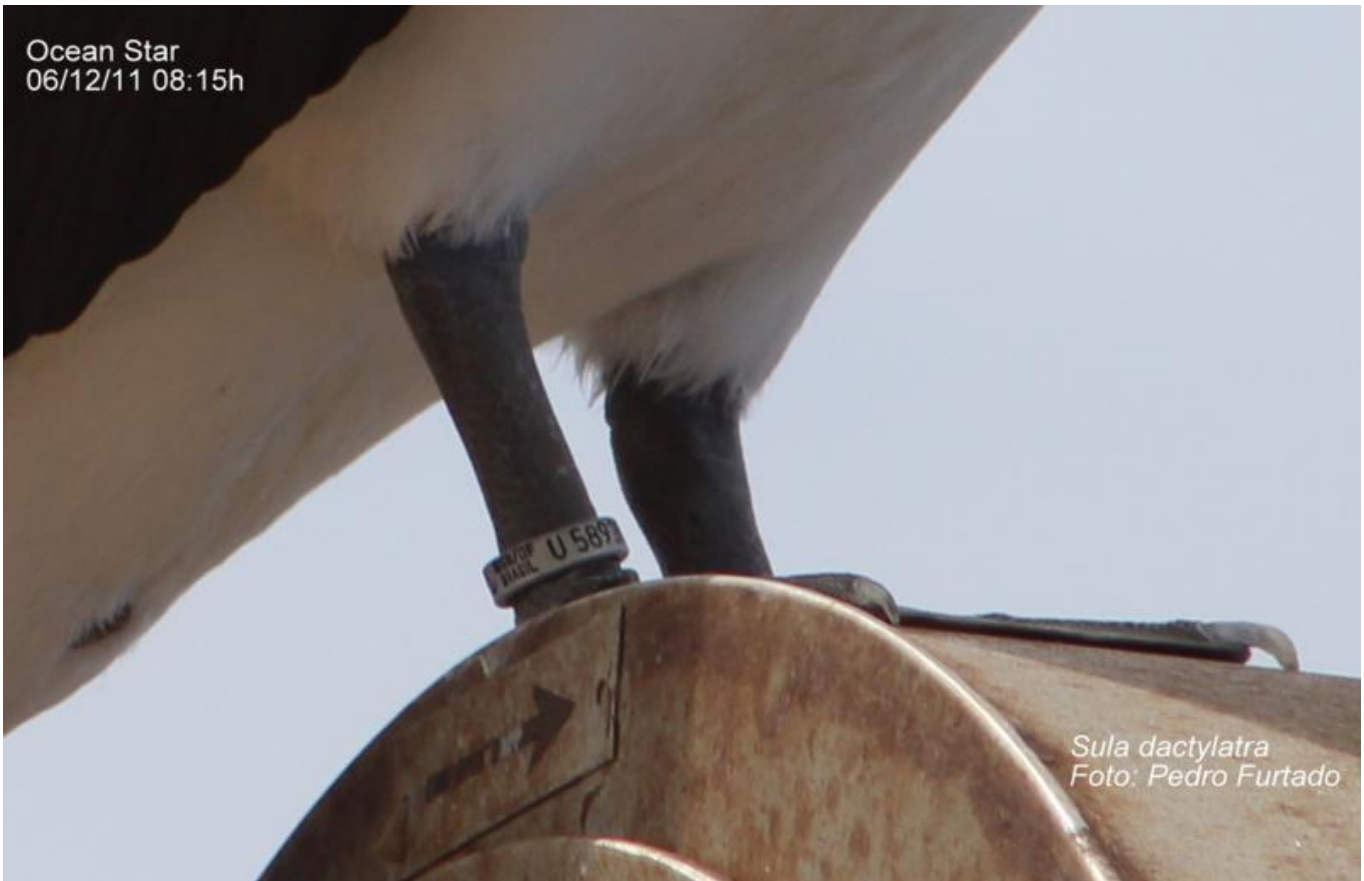
Sula dactylatra