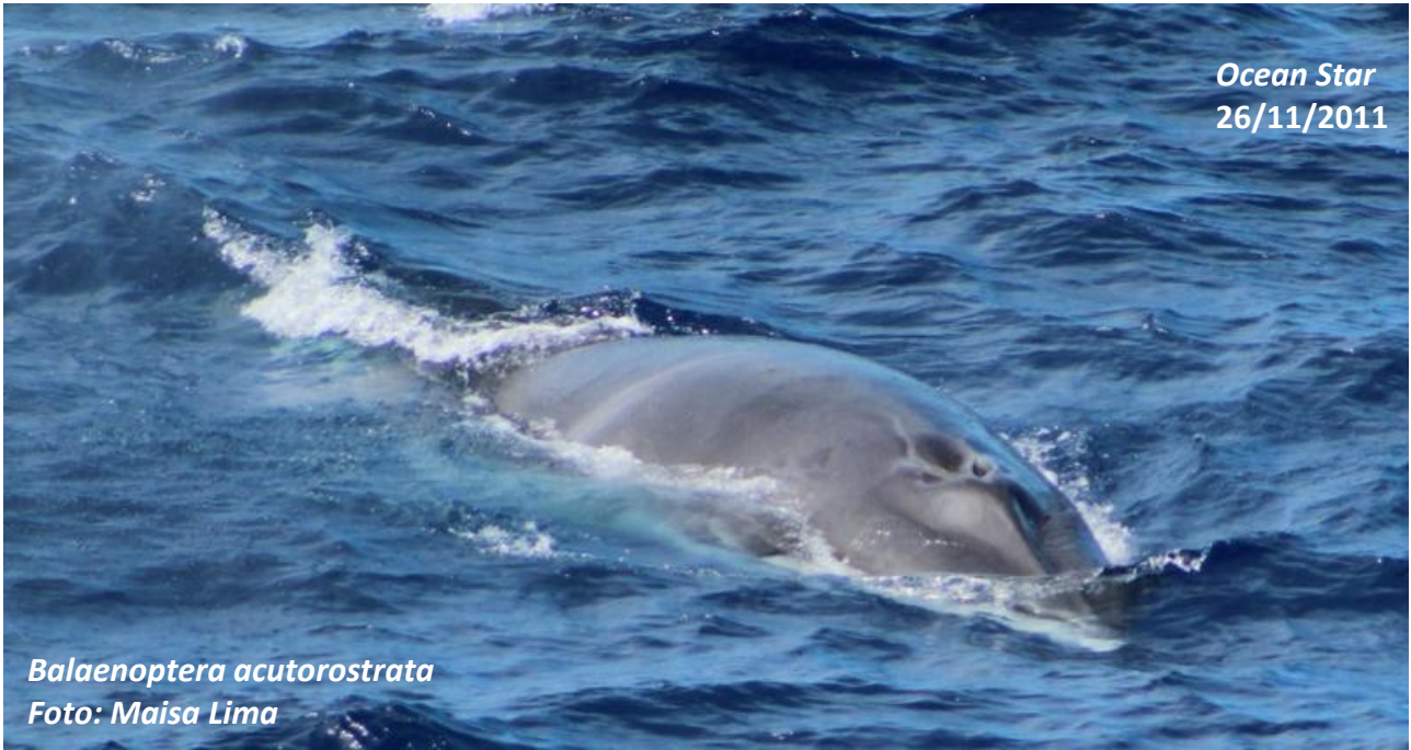
Balaenoptera acutorostrata