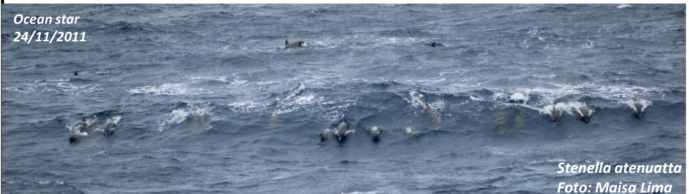
Stenella attenuata