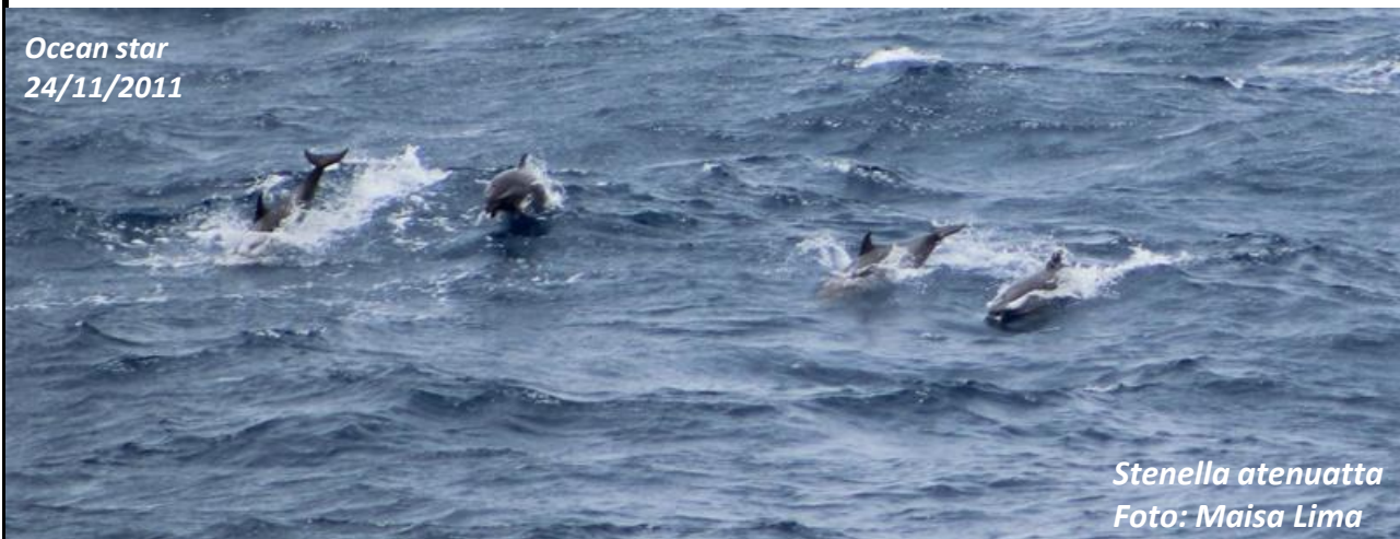
Stenella attenuata