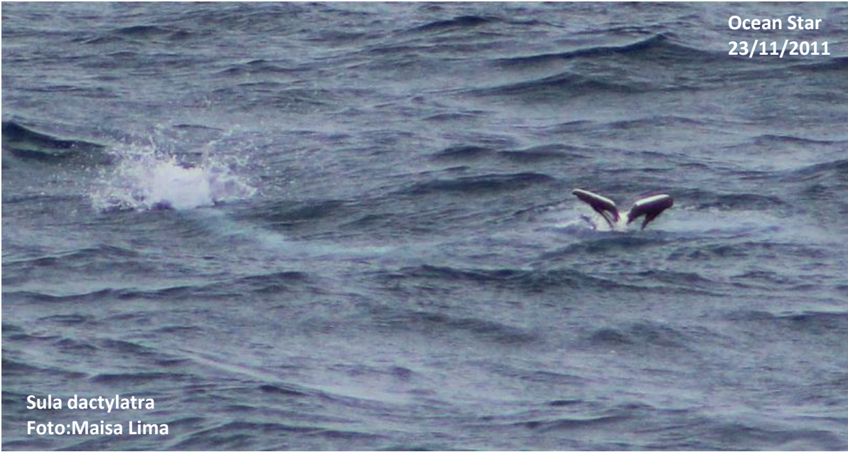
Sula dactylatra