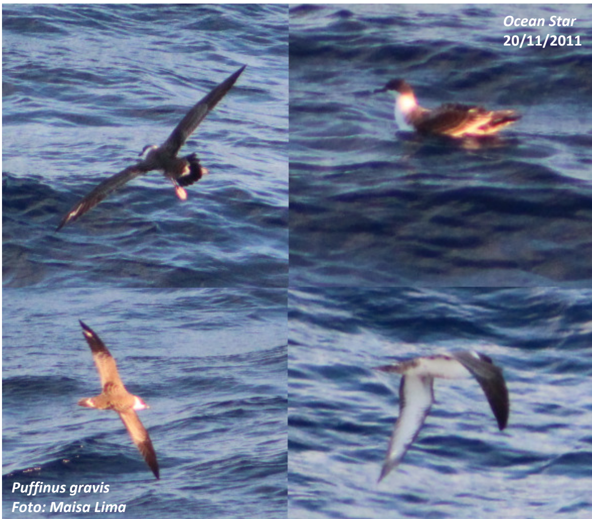
Foto: Sim ( ) Não ( ) Fotos nº: Puffinus gravis_OS_2011-11-20_edit