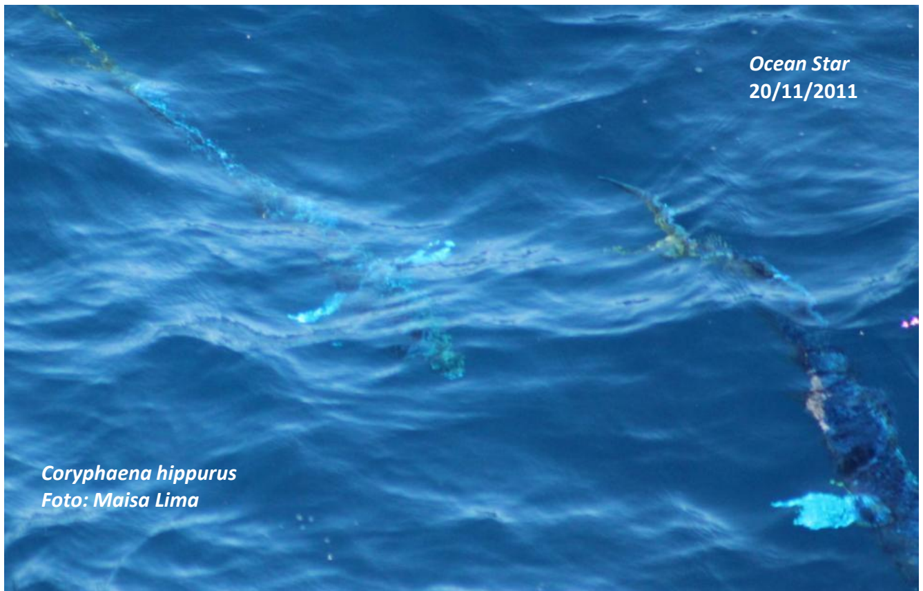
Foto: Sim ( ) Não ( ) Fotos nº: 2011.11.20.BIOTA-040 F(5)