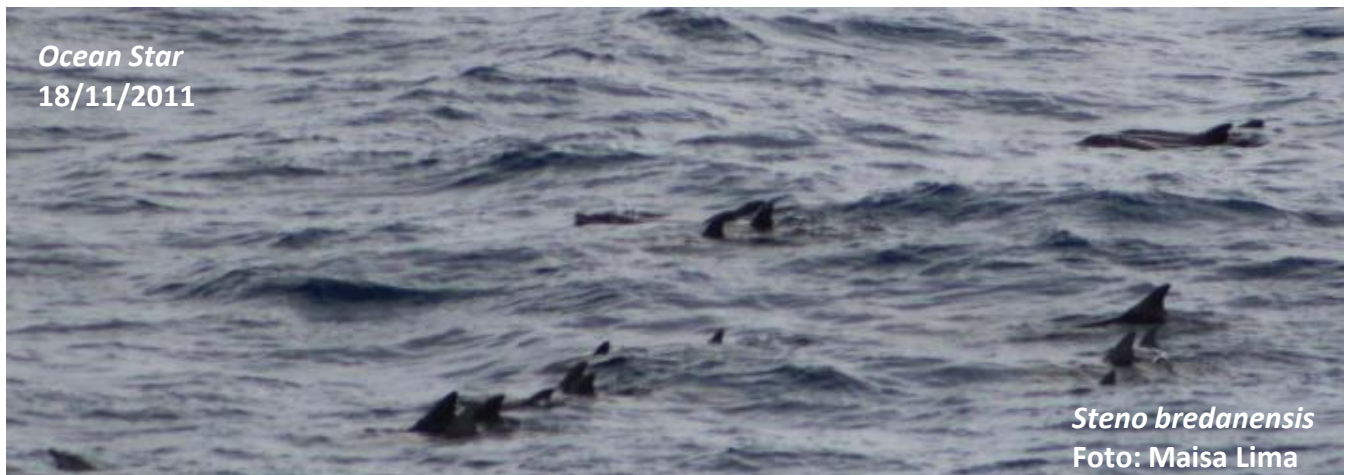
Foto: Sim ( ) Não ( ) Fotos nº: Biota_OS_2011-11-18 (3)