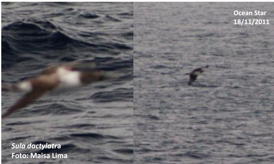
Foto: Sim ( ) Não ( ) Fotos nº: Biota_OS_2011-11-18 (80) e (82)

A espécie apareceu pelo oeste e deslocou em direção a norte, solitário, em deslocamento rápido.