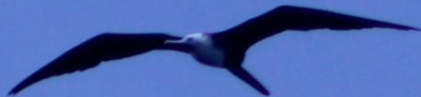
Fregata magnificens