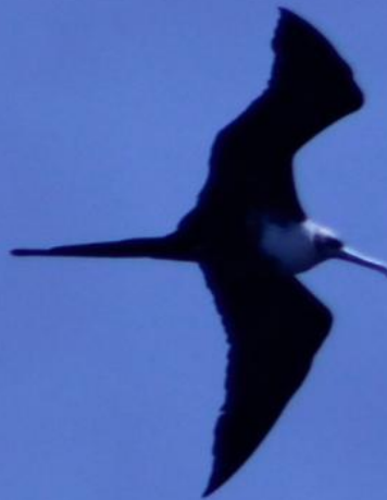
Fregata magnificens