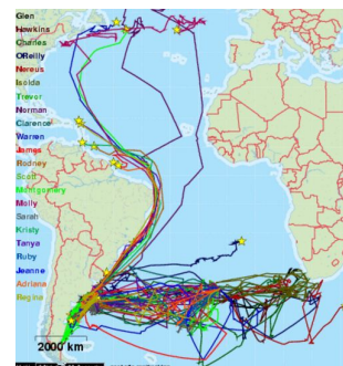
Mapa 4. Projeto Migration and foraging ecology of Greater Shearwater .