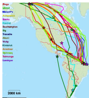
Mapa 3. Projeto Mackenzie Delta Shorebirds .