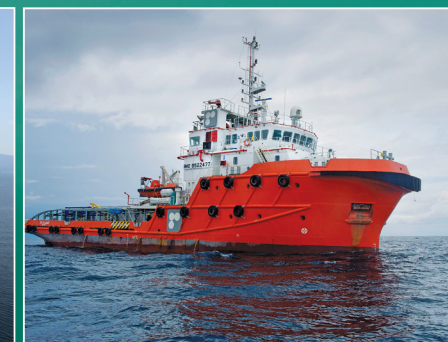
Embarcação de apoio

Fotos ilustrativas do navio-sonda e da embarcação de apoio utilizados na atividade.