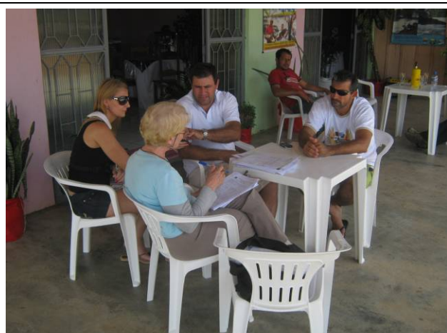
Foto 66: Pescador Profissional sendo entrevistado no município de Paranaíta.