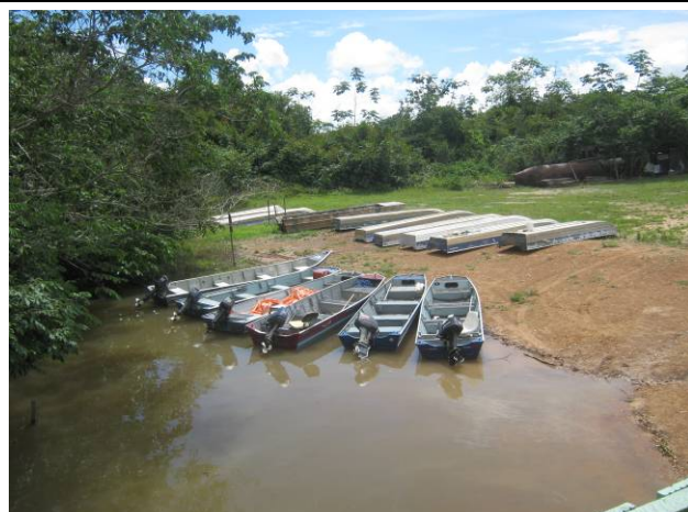
Foto 64: Barcos de associados na margem esquerda do Teles Pires junto a APEP.