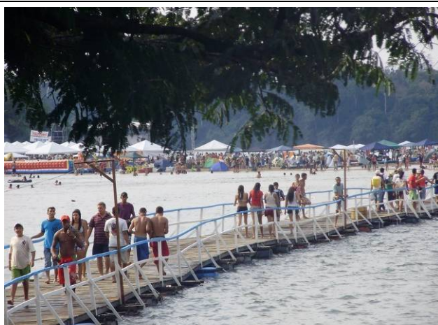
Foto 48: Vista da passarela de ligação do barranco do rio a Ilha Fest Praia.