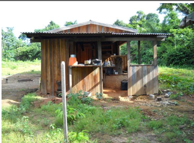
Foto 11: Edificação próxima ao córrego Dez na Fazenda Olho D'Água 3.