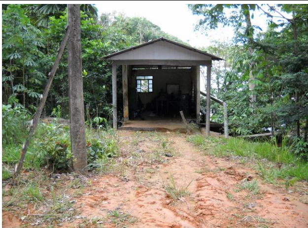
Foto 05: PCH instalada no rio Teles Pires dentro da Fazenda Pontal do Paranaíta.