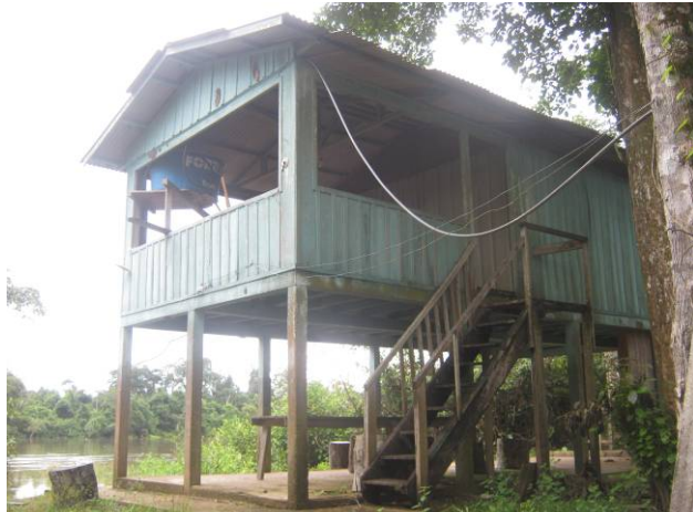
Foto 39: Edificação sem morador na Ilha Itá ou Cheiro da Amazônia.