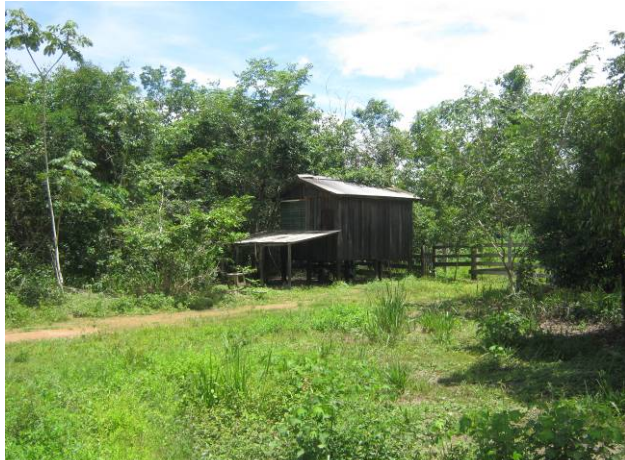
Foto 01: Edificação a cerca de 10m das margens do rio Teles Pires dentro da Fazenda Santo Agostinho.

Registro Fotográfico – Cadastro Socioeconômico – Áreas Afetadas