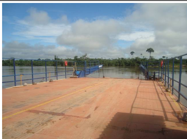
Foto 56: Balsa de travessia de veículos, pessoas e mercadoria denominada Balsa do Cajueiro.