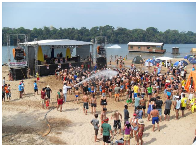
Foto 46: Palco do evento Fest Praia com a presença de uma pousada flutuante ao fundo.