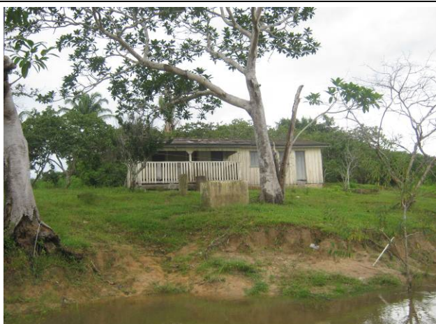
Foto 35: Edificação na margem direita do rio Teles Pires na Fazenda Cassol.