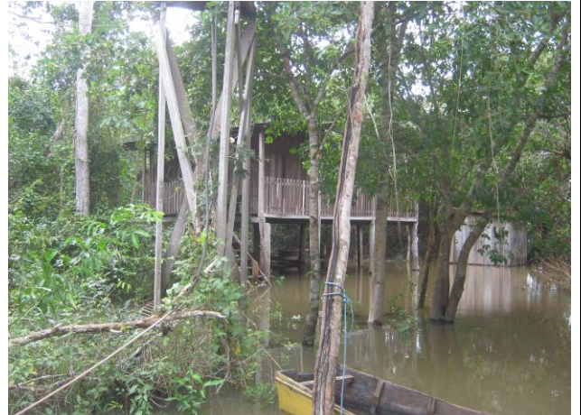
Foto 02: Edificação denominada Rancho do Dorinha na margem esquerda do rio Teles Pires.