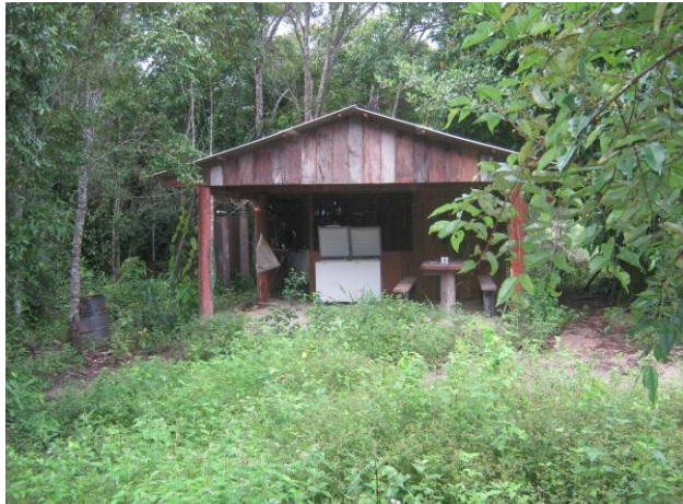
Foto 33: Edificação na margem direita do rio Teles Pires localizado dentro Fazenda Santa Clara.