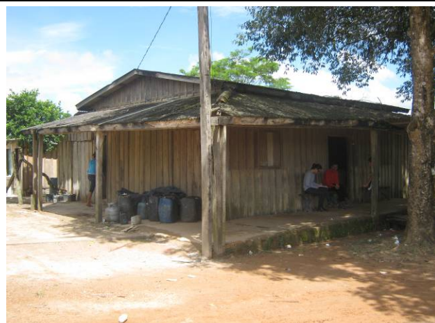
Foto 58: Edificação com moradores que trabalham na Balsa do Cajueiro.