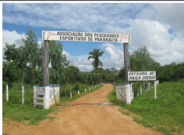
Foto 61: Entrada da Associação dos Pescadores Esportivos de Paranaíta.