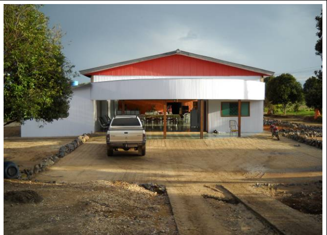
Foto 06: Vista da pousada próximo ao rio Teles Pires na Fazenda Pontal do Paranaíta.