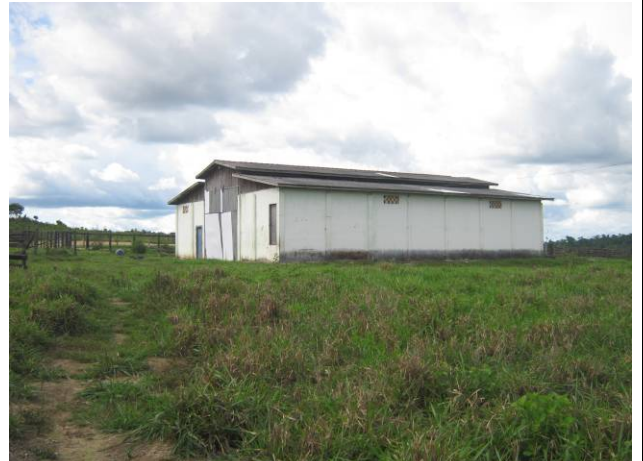
Foto 04: Galpão utilizado para armazenamento de equipamento e maquinário na sede da Fazenda Pontal do Paranaíta.