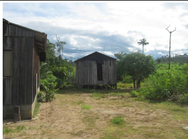
Foto 16: No centro da foto benfeitoria na sede da Fazenda Itororó.