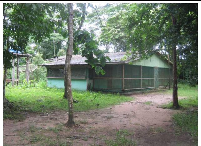
Foto 36: Vista da edificação na margem direita do rio Teles Pires na Fazenda Frizon.