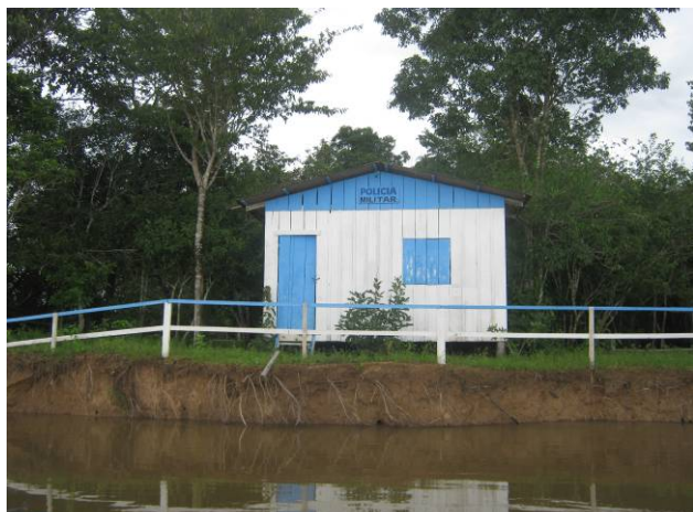
Foto 45: Vista da edificação da Polícia Militar na Ilha Fest Praia.