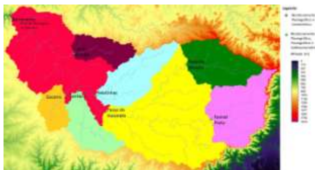
Figura 2 - Local das estações e tipo de monitoramento realizado

As estações são autônomas e auto-suficientes, ou seja, o sistema de fornecimento de energia é baseado em energia solar, captada por painel próprio.