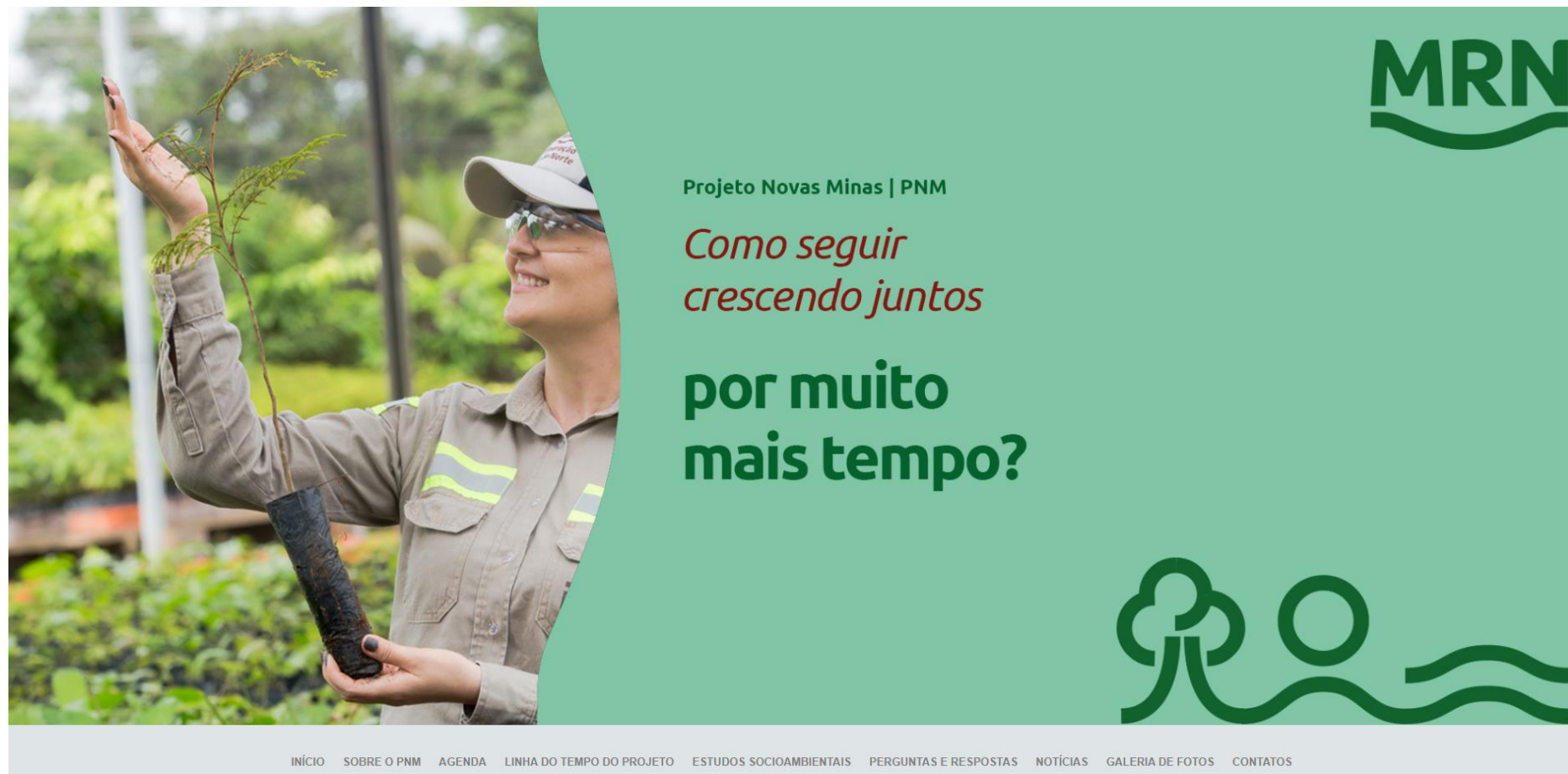
Figura 4: Hotsite: www.mrn.com.br/projetonovasminas