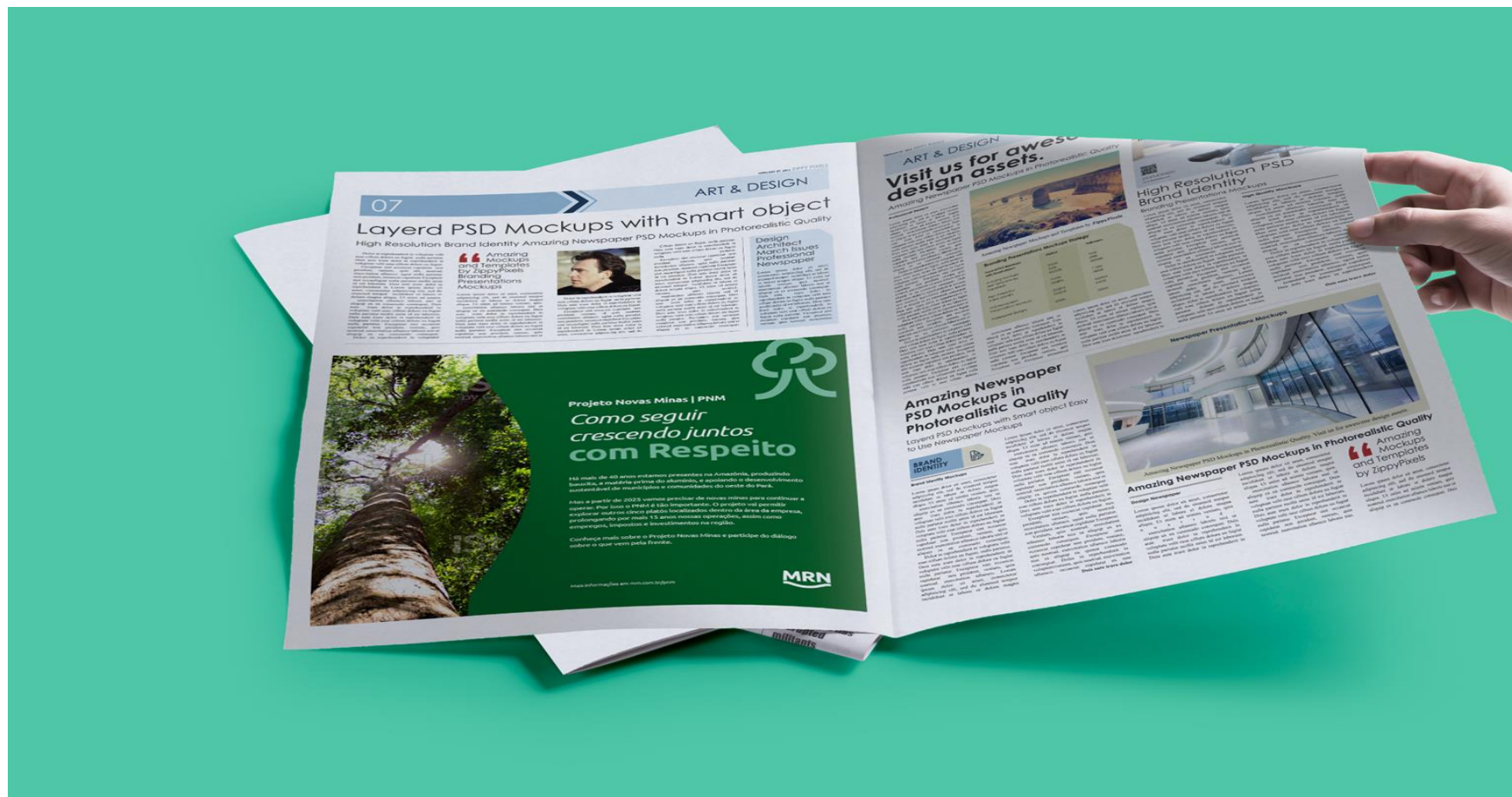
Figura 5: Publicação a ser feita em jornal de grande circulação da região.