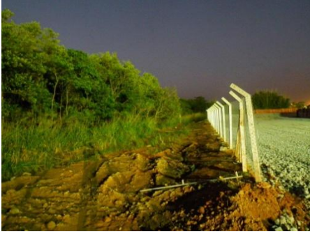
Borda do Manguezal rio Cação à noite, iluminada pelas luzes do canteiro de obras