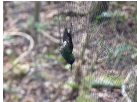
Thalurania glaucopsis capturado na rede de neblina