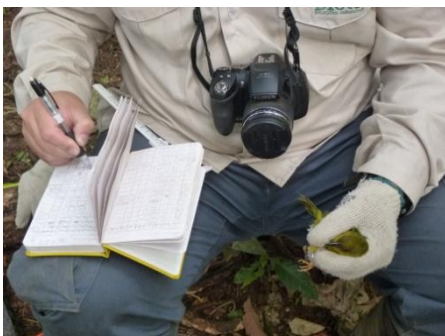
Registro de dados biométricos