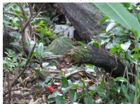
Armadilha de captura e contenção no solo