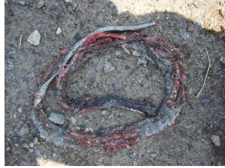
Spilotes pullatus - Importante registro de atropelamento