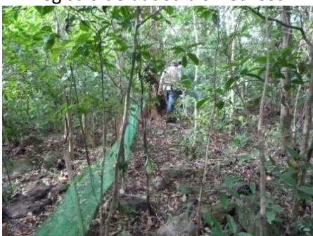
Revisão das armadilhas de interceptação e