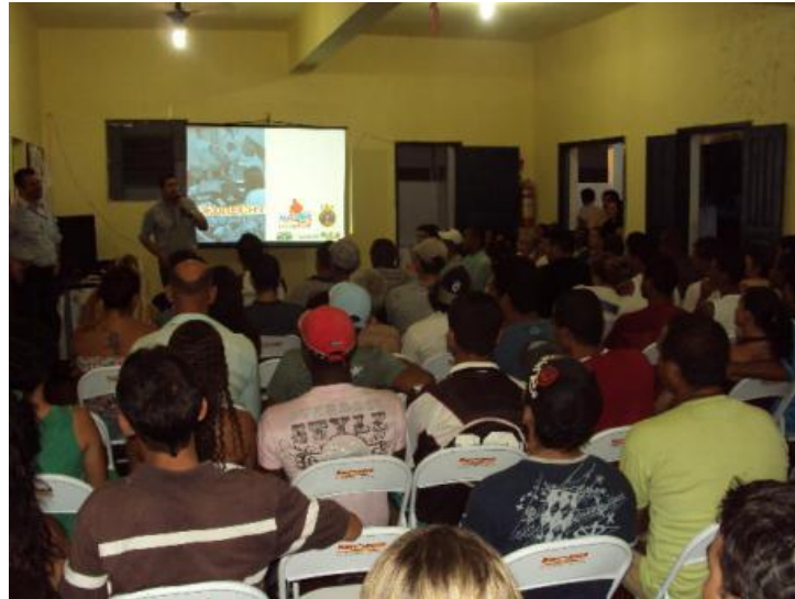
Figura 2 - Divulgação do Programa na Ilha da Madeira.