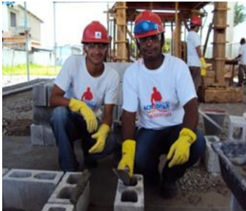
Figura 6 – Alunos em aula prática.