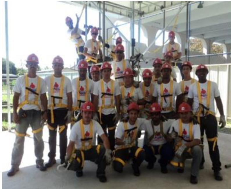
Figura 5 – Turma de montadores de andaime.