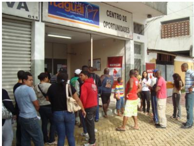
Figura 4 - Período de inscrições para o Programa Acreditar.

Até o momento, foram abertos dois períodos de inscrições no Programa, a saber, entre os dias 14 e 18 de dezembro de 2009 e entre os dias 27 de junho e 01 de julho de 2011, no município de Itaguaí. Ao total se inscreveram 6.882 pessoas, em sua maioria moradores de Itaguaí, com algumas inscrições de moradores de municípios vizinhos (Figura 4). Diante da expressiva procura, até o momento, não foram abertas novas inscrições.