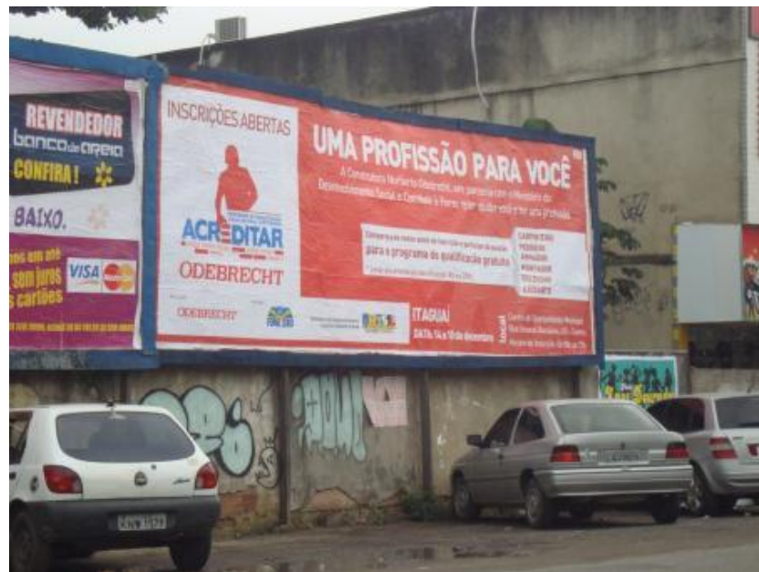
Figura 1 - Outdoor exposto no município de Itaguaí.