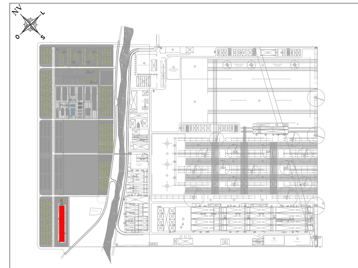
PLANTA ESQUEMÁTICA E: 1/15.000