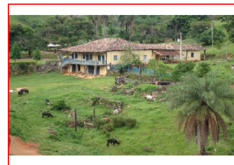
5 - Fazenda Rio Vermelho