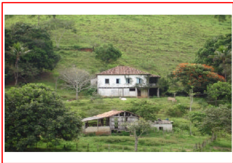
7 - Fazenda São Vitorino