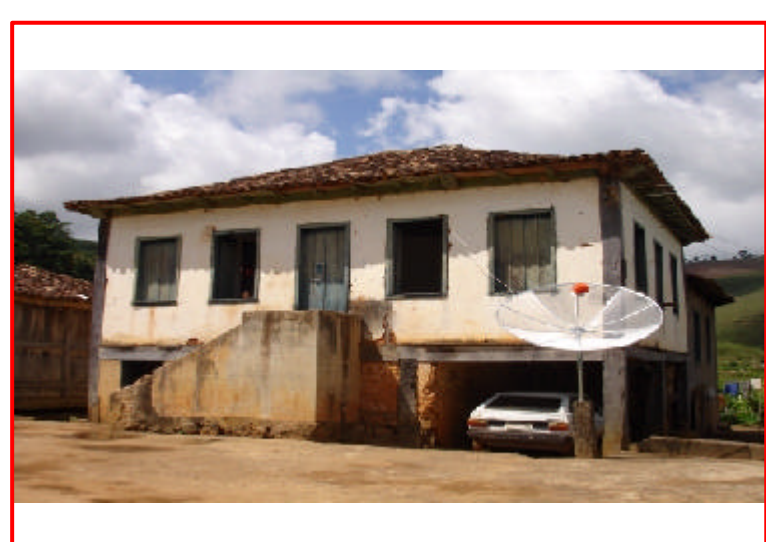
8 - Fazenda Boa Vista