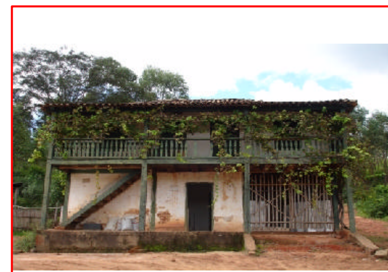
4 - Fazenda Contendas