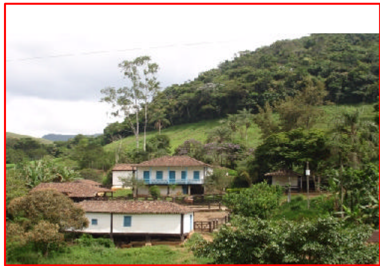
6 - Fazenda da Barra