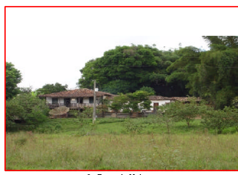
2 - Fazenda Meloso