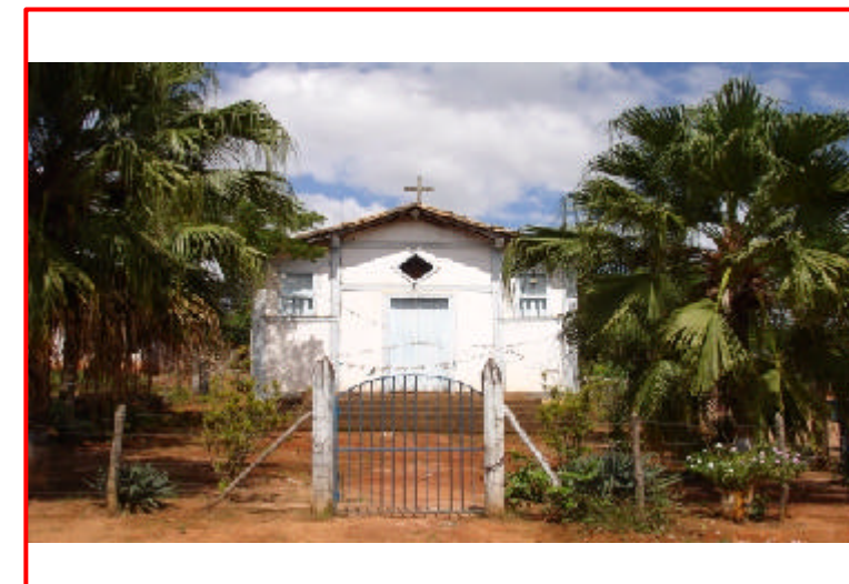
3 - Capela São José do Meloso