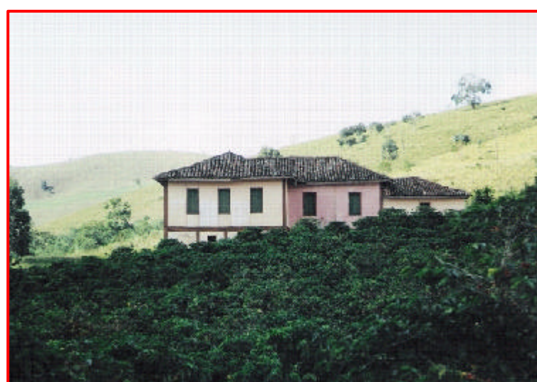
9 - Fazenda Vargem Grande