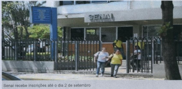
Senai recebe inscrições até o dia 2 de setembro