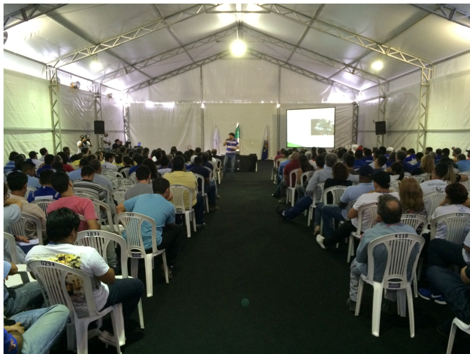
Figura I: Palestra sobre Educação Ambiental durante a SIPAT 2015.