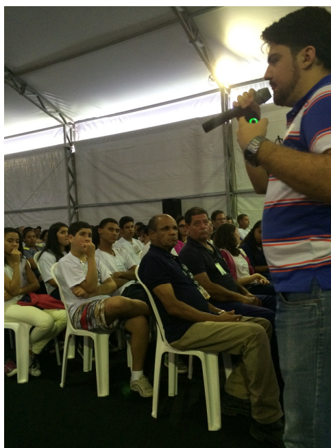
Figura II: Palestra sobre Educação Ambiental durante a SIPAT 2015.