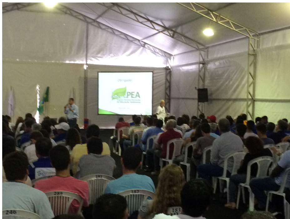
Figura III: Palestra sobre Educação Ambiental durante a SIPAT 2015.