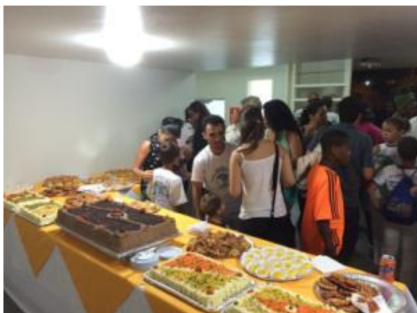
Figura 5: Momentos de descontração e bate-papo durante a festa de confraternização do PEA.