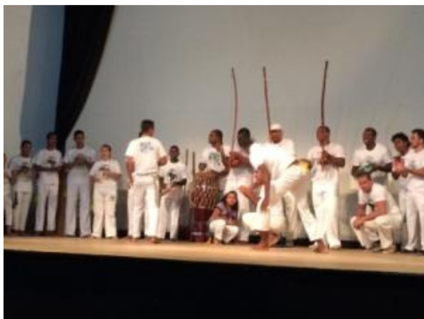
Figura 4: Apresentação de capoeira durante a festa de confraternização do PEA.