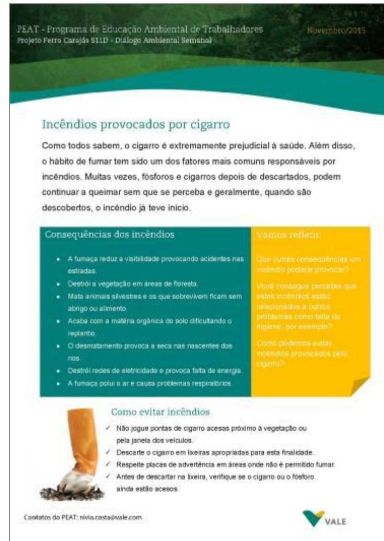
Higiene na Operação – Cigarro e incêndios