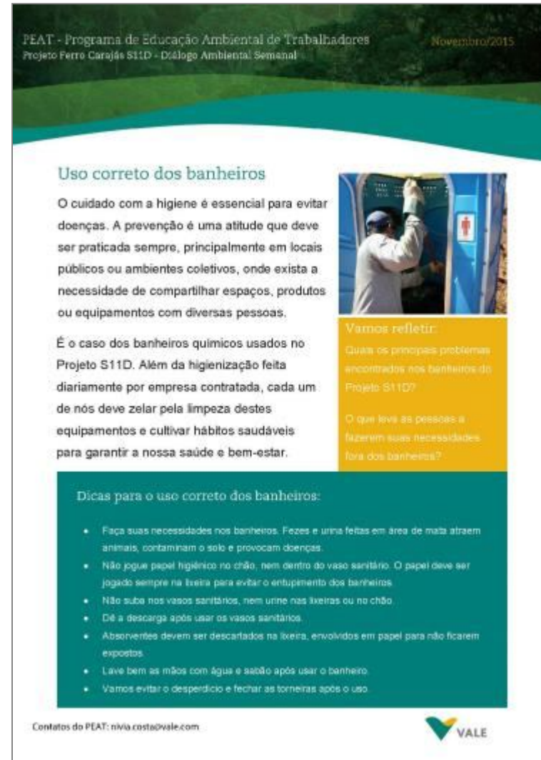
Uso correto dos banheiros