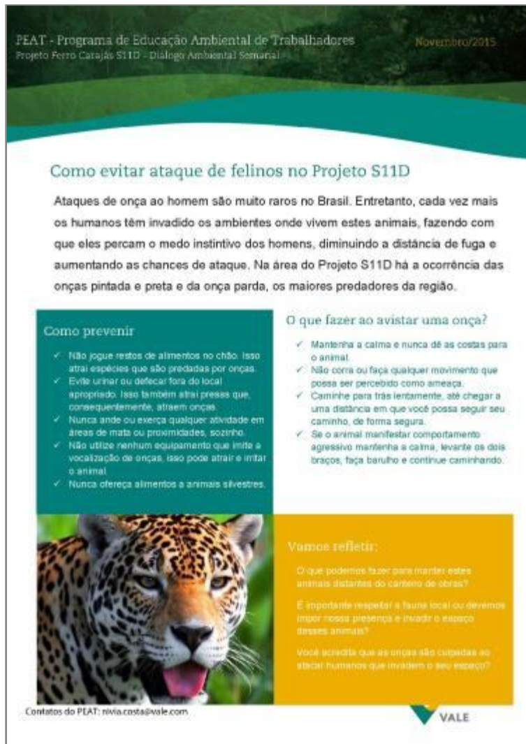
Ataque de animais