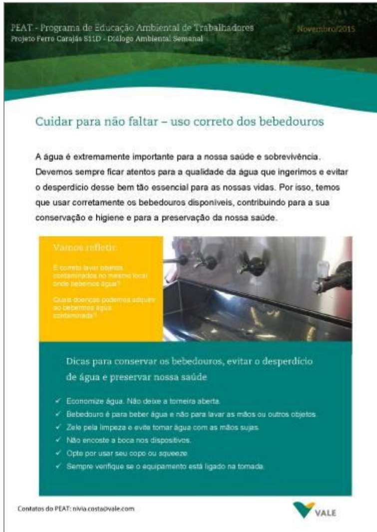
Como usar os bebedouros