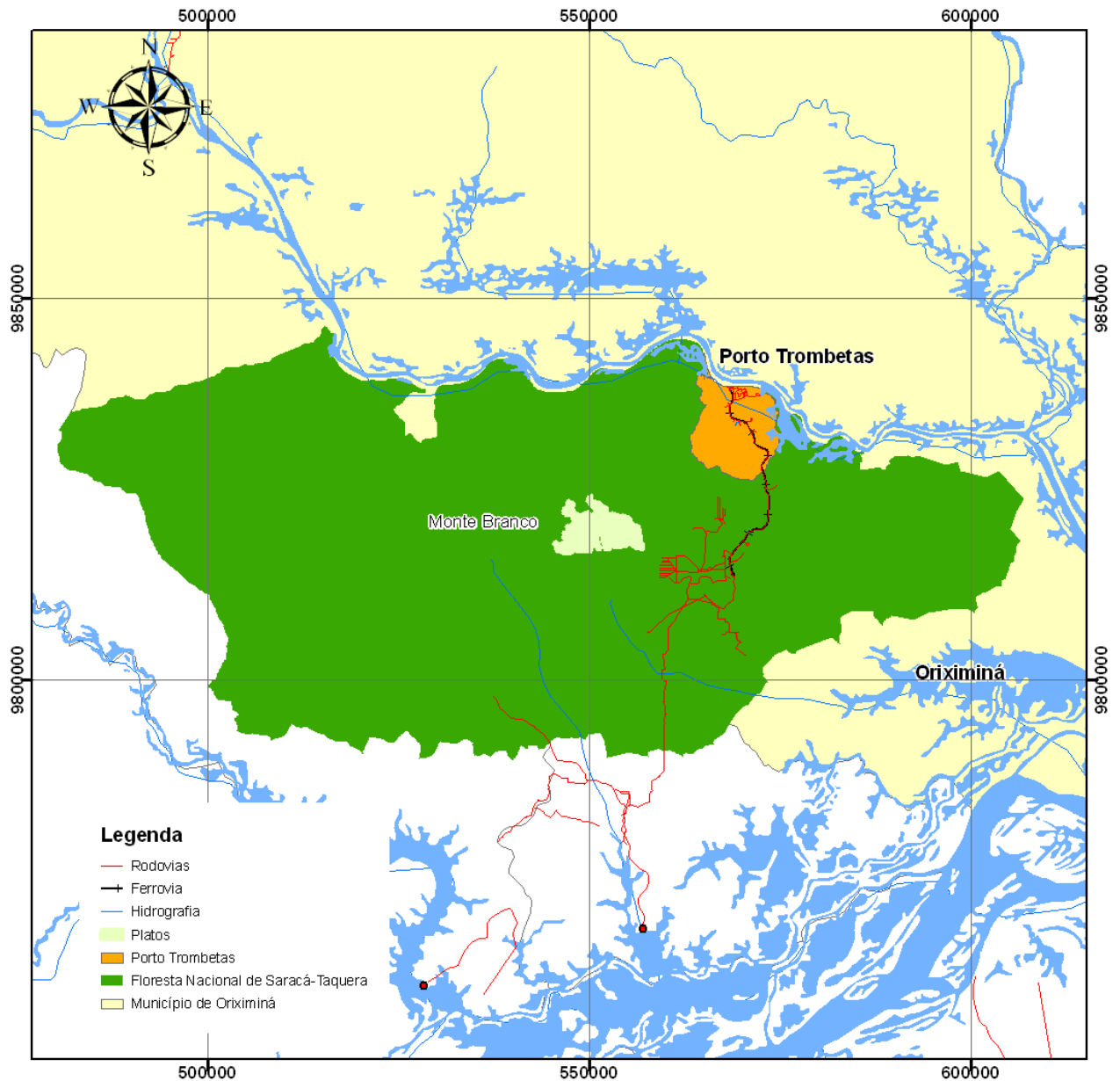
Figura 2.02– Localização do Platô Monte Branco no Contexto da Floresta Nacional de Saracá-Taquera