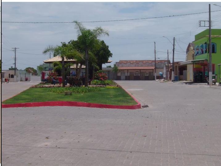
PONTO 03 E-293749 N-7654627