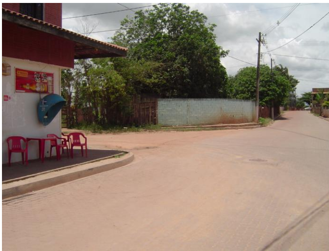
PONTO 02 E-294125 N-7656429