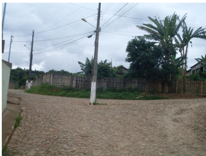
06 – E-630649 N-7719756