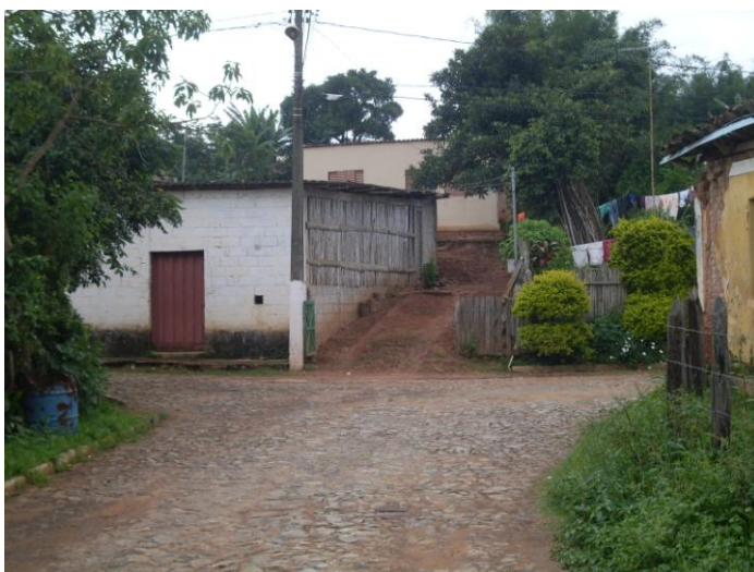
07 – E-630739 N-7719707