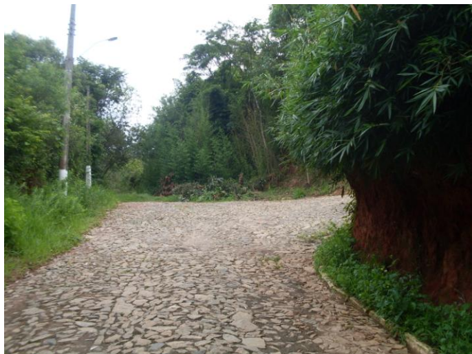
04 – E-630591 N-7720162