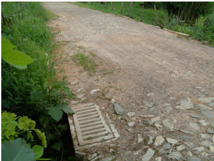
05 – E-630640 N-7719980