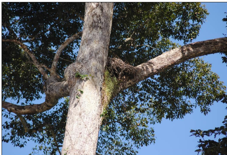
Foto 3.01 – Ninho de Morphnus guianensis (Falso Gavião Real) registrado no Platô Saracá-Oeste em 2012