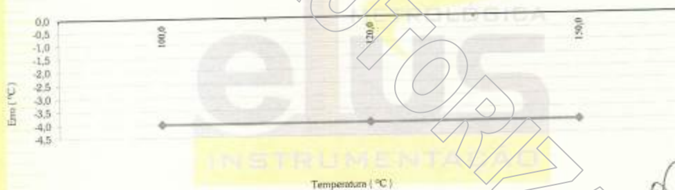
ILUSTRAÇÃO GRÁFICA DA CURVA DE CALIBRAÇÃO: