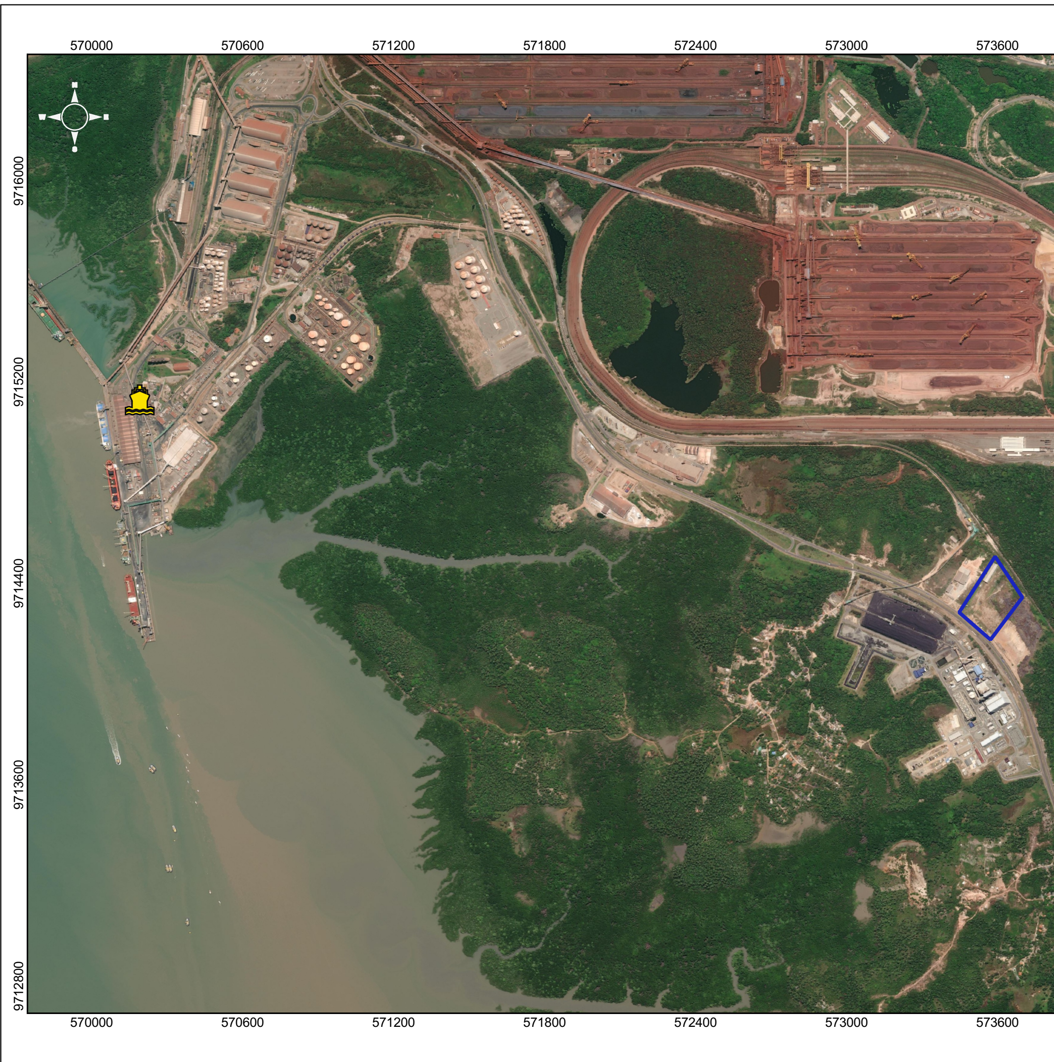
Figura 3.3.1.3-2: Local de descarregamento e do beneficiamento do material dragado.