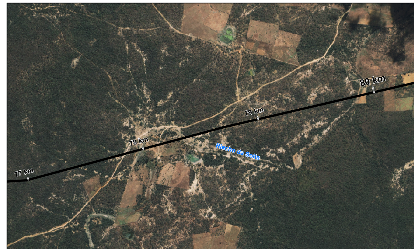
Riacho da Solta