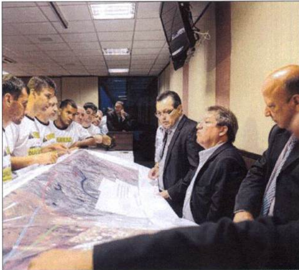
Governador Silval Barbosa, Wallace Guimarães e empresários da Rodovia dos Imigrantes

O prefeito Wallace Guimarães e o secretário Gonçalo Aparecido e Barros lembraram da proposta do secretário de Indústria, Comércio e Mineração do Estado, Alan Zanatta que deseja aplicar parte da arrecadação federal com o agronegócio em obras de logística. "Somos responsáveis por US$ 12,9 bilhões em 2012 de superávit da Balança Comercial do Brasil e precisamos de parte destes recursos para realizar as obras importantes", disse Wallace Guimarães.