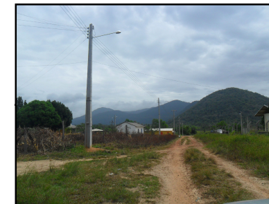
Ponto Notável N° 61 - Comunidade Vila Itã