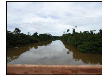
Ponto Notável N° 56 - Rio Anauá

© Ecology & Environment do Brasil GIS Department W:\2517-LT500KV_Manauas-BoaVista\EIA_rev01\MXD\2517-01-EIA-MP-5001-01_PontosNotaveis_FL56.mxd 14/03/2014