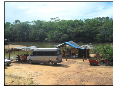
Ponto Notável N° 55 - Praia do Anauá